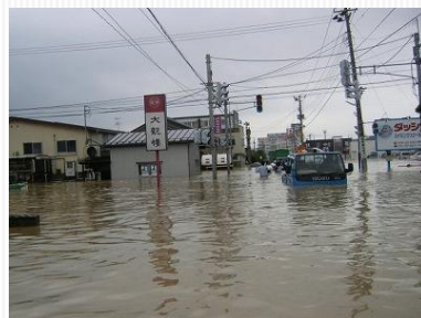
H16年 7.13新潟・福島豪雨の様子

加入している火災保険の水災補償の有無と損害保険金の支払いの内容を確認して、住んでいる地域の水害リスクを把握した上で、リスクに応じた火災保険に加入することをお勧めします。